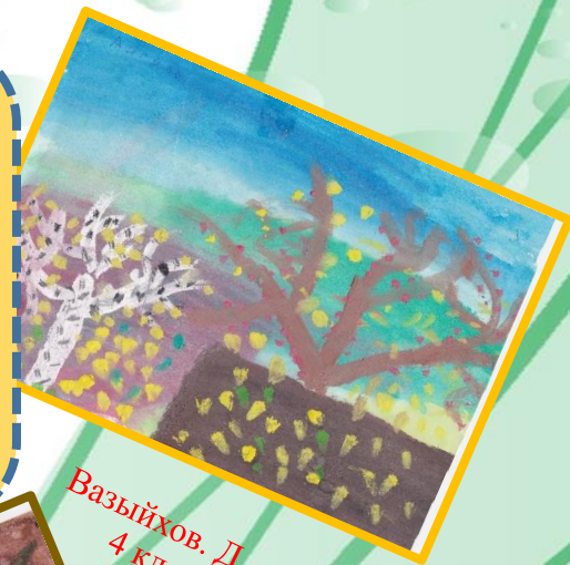
Вазыйхов. Д 4 кл